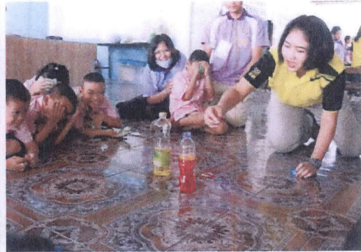
นักเรียนทำการทดลองในกิจกรรมเสริมสร้างทักษะการเรียนรู้ด้านวิทยาศาสตร์