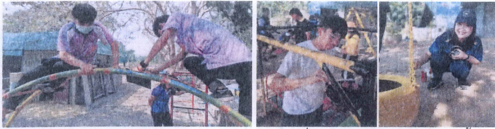
อาจารย์และนักศึกษาจิตอาสาซ่อมแซมและทาสีเครื่องเล่นให้กลับมาสวยใหม่อีกครั้ง