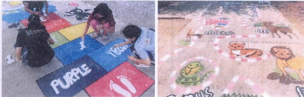
นักศึกษาจิตอาสาช่วยกันออกแบบและทาสีพื้นสนามเด็กเล่นเพื่อการเรียนรู้