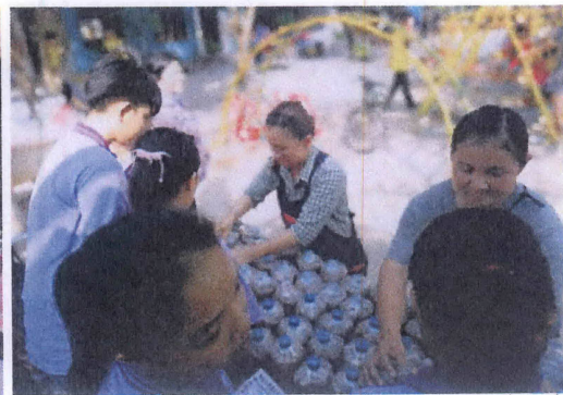
นักเรียนและผู้ปกครองร่วมทำกิจกรรมเสริมสร้างทักษะอาชีพด้านการเพาะเห็ดและการทำเครื่องดีมี